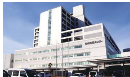
【施工実績】仙台医療センター（仙台市宮城野区）