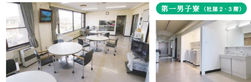
第一男子寮 (社屋2・3階)

食事や住まいの心配をせず、仕事に集中できるよう独身寮を完備。集団生活を通して社会のルールやマナーを学ぶことができます。また仲間たちと切磋琢磨することで、人間としても、さらに成長できる環境が整っています。