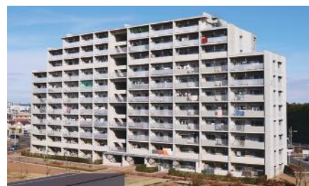
【施工実績】災害公営住宅「荒井東市営住宅」（仙台市若林区）

また、大型マンションやショッピングセンターなどの鉄筋コンクリート造の現代建築においても欠かせない存在で、内外壁・天井・床のタイル面、塗装前の下地工事と、建物のあらゆる面に必要なのが「左官工事」。自分の携わった建物が後世に残るといふ大きなやりがいも、この仕事ならではの。